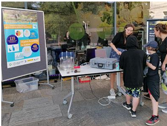
Lange Nacht der Forschung im Mai 2022