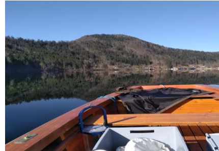
Der Lunzer See

AquaScale untersucht Biodiversität aquatischer Lebensgemeinschaften über räumliche und zeitliche Skalen hinweg. Dabei haben wir sowohl die Ursachen von biologischer Vielfalt im Auge, als auch den Zusammenhang zwischen Biodiversität und der Funktion von Ökosystemen. Wir kombinieren experimentelle Forschung mit der Analyse von Langzeitdaten, um den Einfluss von Klimawandel auf aquatische Lebensräume besser zu verstehen.