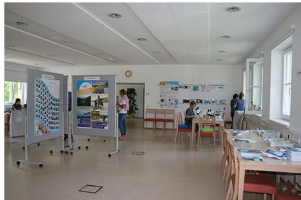
Tag der offenen Tür am WCL im September 2022