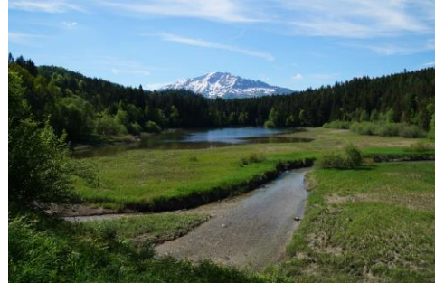
Von der Quelle bis zum Meer

Carbocrobe hat sich zum Ziel gesetzt, die Geheimnisse der kleinsten Organismen, die am Umsatz von Kohlenstoff in Binnengewässern von der Quelle bis zum Meer beteiligt sind, besser zu verstehen und zu enträtseln. Wir verwenden experimentelle und Feldstudien, um die Rolle von Mikroben in Kohlenstoff- und anderen Nährstoffkreisläufen in aquatischen Ökosystemen zu erforschen.