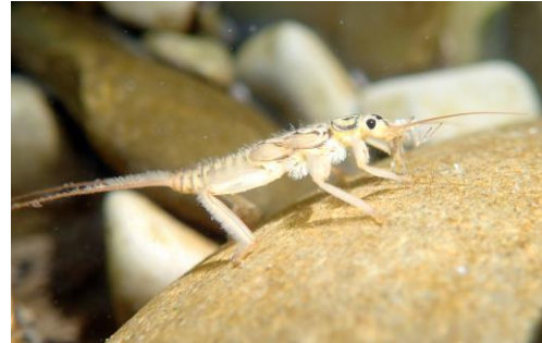
Perla sp Sarantoporos

Insekten stellen einen Großteil der makroskopischen aquatischen Biodiversität in Süßwasserökosystemen dar. Die Arbeitsgruppe Quiver befasst sich mit der Diversität von aquatischen Insekten, ihrer Evolutionsökologie und den treibenden Faktoren, die lokale und regionale Biodiversitätsmuster in dieser Gruppe bedingen. Ein weiteres Ziel ist die Erfassung der Bedeutung von Diversität in einem ökosystemischen Kontext als Grundlage von Funktionalität und Vernetztheit.