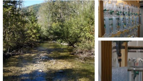
2018-2020: UNiTED project